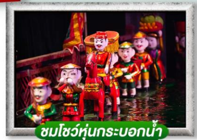
ชมโชว์หุ่นกระบอกน้ำ