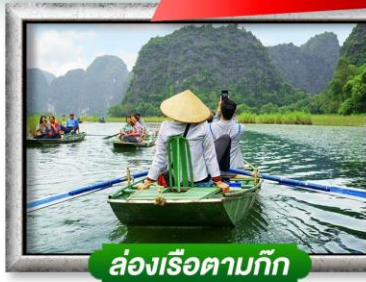
ล่องเรือตามก๊ก