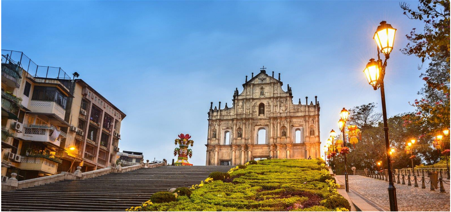
วิหารเซนต์ปอล

ออกแบบโดยสถาปนิกชาวอิตาลี ด้านหลังของโบสถ์มีพิพิธภัณฑ์จัดแสดงประวัติศาสตร์ของโบสถ์แห่งนี้ไว้ โบสถ์เซนต์ปอลได้รับการยกย่องให้เป็นอนุสาวรีย์แห่งศาสนาคริสต์ที่ยิ่งใหญ่ที่สุดในดินแดนตะวันออกไกล