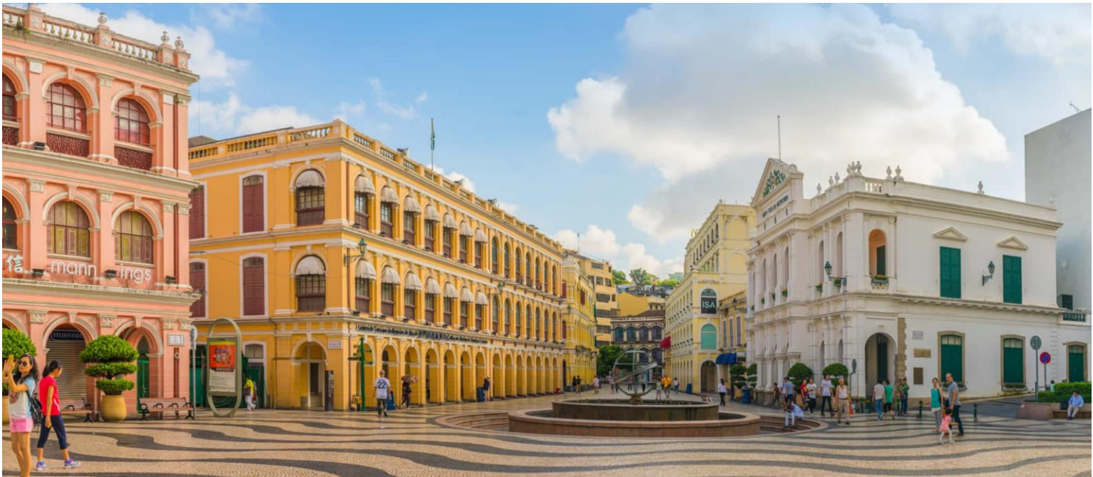
เซนาโต้ สแควร์ SENADO SQUARE

ออกแบบโดยสถาปนิกชาวอิตาลี ด้านหลังของโบสถ์มีพิพิธภัณฑ์จัดแสดงประวัติศาสตร์ของโบสถ์แห่งนี้ไว้ โบสถ์เซนต์ปอลได้รับการยกย่องให้เป็นอนุสาวรีย์แห่งศาสนาคริสต์ที่ยิ่งใหญ่ที่สุดในดินแดนตะวันออกไกล