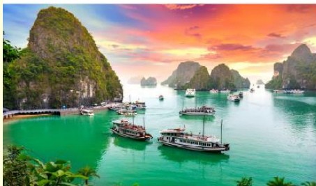
ล่องเรือชมอ่าวฮาลอง