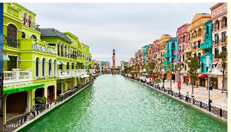
เมก้าแกรนด์เวิลด์ฮานอย

*ทางบริษัทฯ ขอสงวนสิทธิ์ในการสลับโปรแกรมทัวร์ตามความเหมาะสมขึ้นอยู่กับสถานการณ์หน้างาน โดยคำนึงถึงผลประโยชน์ของลูกค้าเป็นสำคัญ