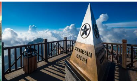
ยอดเขาฟานซิปิน