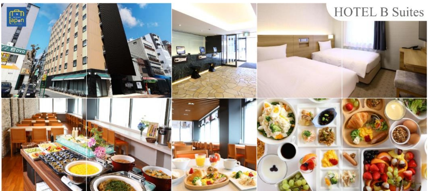
HOTEL B Suites

HOTEL B SUITES NAMBA, OSAKA หรือเทียบเท่าระดับเดียวกัน