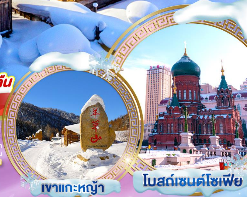
เงาแกะหย้า