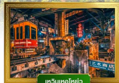
เหวินเหอไห่ยว่