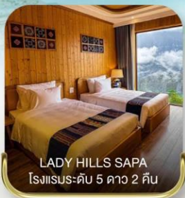
LADY HILLS SAPA โรงแรมระดับ 5 ดาว 2 คืน