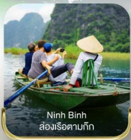
Ninh Binh ล่องเรือตามกีก