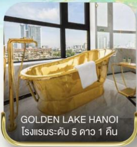
GOLDEN LAKE HANOI โรงแรมระดับ 5 ดาว 1 คืน