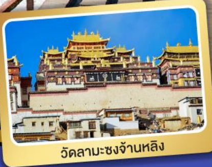
วัดลามะซงจ้านหลิง