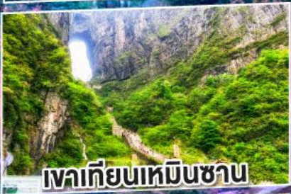
เขาคีเยนเหมินซาน