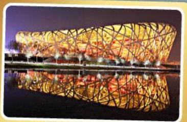
สนามกีฬารังนก