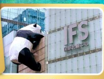
หมิวแพนด้ายักษ์ป็นตึกถนนชูลู่