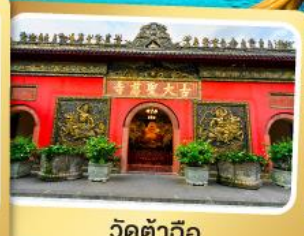
วัดต้าฉือ