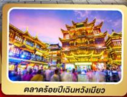
ตลาดร้อยปีเงินหวังเมียว