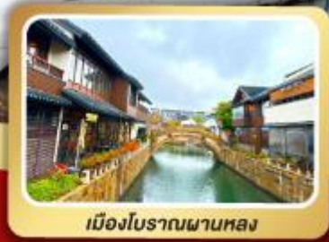
เมืองโบราณผานหลง