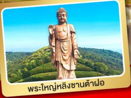
พระใหญ่หลิงซานต้าฝอ