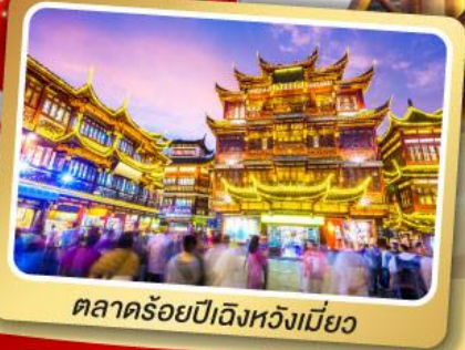
ตลาดร้อยปีฉงหวงเหมียว