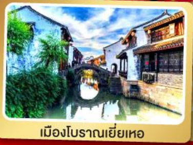
เมืองโบราณยี่เหอ