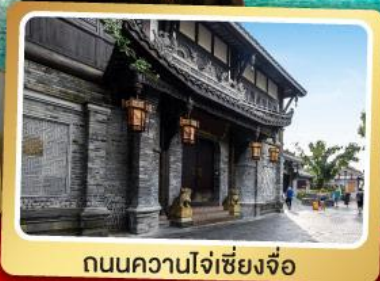
ถนนความใจ๋เซียงจื่อ