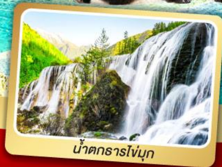
น้ำตกธารไ่บุ๊ก