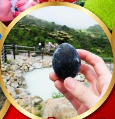
หุบเขาโอวาคูดานิ