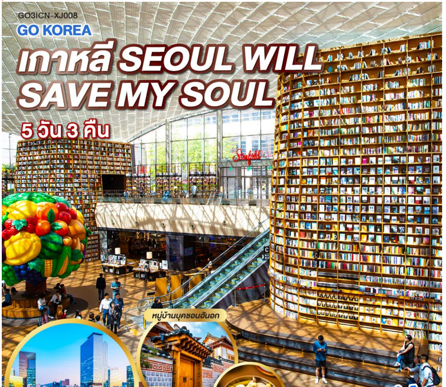
หมู่บ้านบุคซอนอันอก