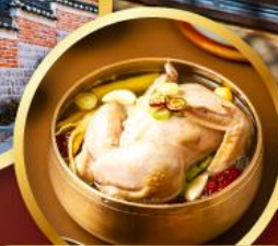
ไก่ตุ๋นโสม ระดับมิชลิน

พิเศษ เมนูไก่ตุ๋นโสม ภัตตาคารระดับมิชลิน