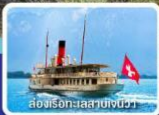
ล่องเรือทะเลสาบเจนีวา