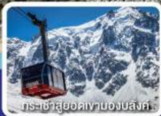
กระเช้าสู่ยอดเขามองบล็องค์