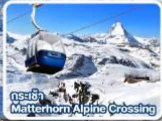
กระเช้า Matterhorn Alpine Crossing