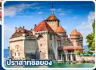
ปราสาทซิลยง