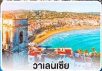
วาเลนเซีย