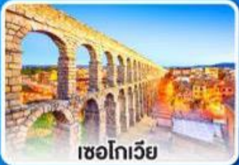
เซโกเวีย