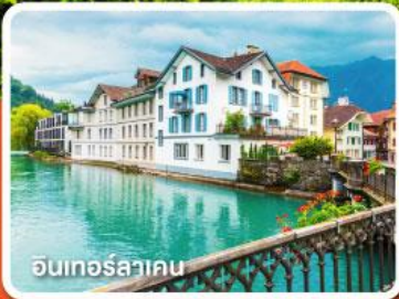
อินเทอร์ลาคอน