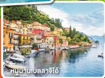
หมู่บ้านเบลลาจีโอ