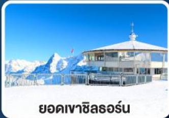
ยอดเขาซิลรอร์น

เข้าชมความสวยงาม พระราชวังเฮเรียนเคียมเซ่ "แวร์ซายน์แห่งเยอรมนี"