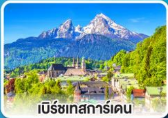
เบิร์ชเทสการ์เดน