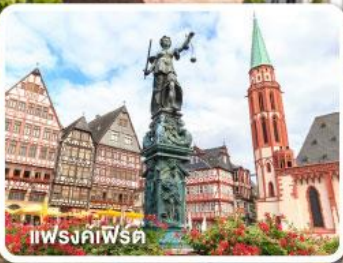
แฟรงค์เฟิร์ต