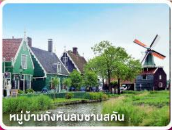
หมู่บ้านกังหันลมซานสคิน