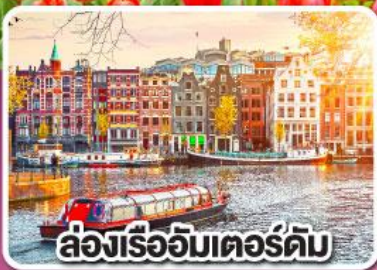
ล่องเรืออัมสเตอร์ดัม