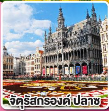
จัตุรัสกรองด์ ปลาซ

ล่องเรือหลังคากระจก ชมความสวยงาม ของกรุงอัมสเตอร์ดัม