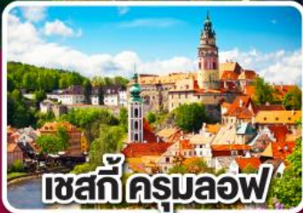
เชสกีครุมลอฟ

ฮังการี สโลวาเกีย ออสเตรีย เชก 7 วัน 4 คืน