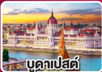
บูดาเปสต์