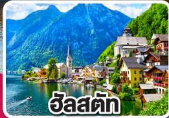
ฮัลสตัดท์