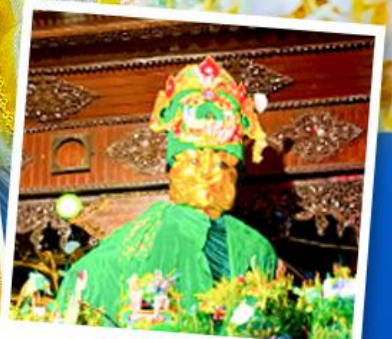
ขอพรมแม่ยักษ์