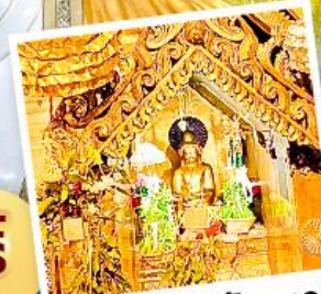
พระสุริยันจันทร