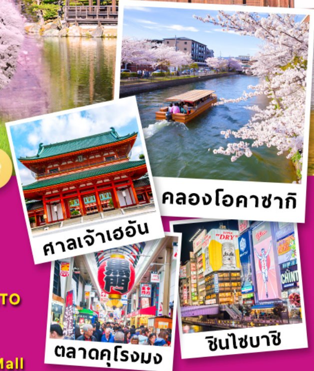
คลองโอคาซากิ