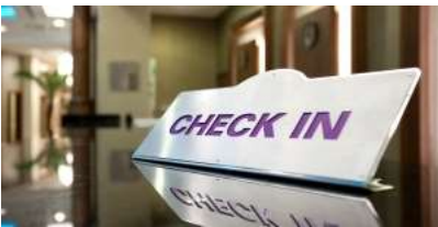
เช็คอินเข้าโรงแรมปูซาน

เลียบทะเลแฮอุนแด เมืองท่าอันดับ1ของประเทศเกาหลีใต้ ตัวแคปซูลหนึ่งคันจะนั่งได้ 4ท่าน แต่ละแคปซูลก็จะมีสีสันสดใส น้ำเงิน แดง เหลือง เขียว เล่นสลับๆกันไป สีสวยตัดกับท้องฟ้า แล่นคู่ขนานกับรถไฟขมทะเลด้านล่าง ระหว่างนั่งในแคปซูลท่านจะได้ชมวิวเมืองปูซานได้ทั้งซ้ายและขวา แคปซูลจะแล่นช้าๆให้เราไปชื่นชมความงาม ของวิวทะเล และวิวตัวเมือง ถือว่าเป็นที่เที่ยวเปิดใหม่ล่าสุด ที่น่าไปเที่ยวมากๆเลยทีเดียว