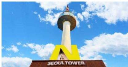
คืนได้แบบ 360 องศา

สวนสนุกล็อตเต้เวิลด์ สวนสนุกในร่มที่มีเครื่องเล่นมากมาย โดยพื้นที่ภายในจะแบ่งเป็น 2 โซนใหญ่ๆ คือ Adventure เป็นสวนสนุกในร่มที่รวมเครื่องเล่นไว้มากมาย ทั้งไวคิง ม้าหมุน บ้านผีสิง ฯลฯ รวมถึงมีลานไอซ์สเก็ตในร่มอีกด้วย ส่วนอีกโซนชื่อว่า Magic Island เป็นโซนกลางแจ้ง อยู่ติดกับทะเลสาบชกซอนไฮซู มีปราสาทสวยๆ ตั้งเด่นเป็นสง่า ตรงนี้แหละค่ะเป็นจุดถ่ายรูปที่คนเกาหลีฮิตมากๆ ถ้าจะให้ปังสุดๆ ต้องเช่าชุดนักเรียนน่ารักๆ มาใส่ถ่ายรูปด้วยนะ โซนกลางแจ้งมีเครื่องเล่นไฮไลท์เป็น Gyro Drop ดรอปทาวเวอร์ สูง 70 เมตร และเครื่องเล่นมันส์ๆ อีกมากมาย ใครชอบความท้าทายต้องไม่พลาด