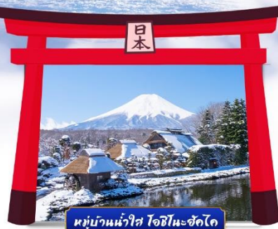
หมู่บ้านน้ำใส ไอชิโนะฮะชิโด