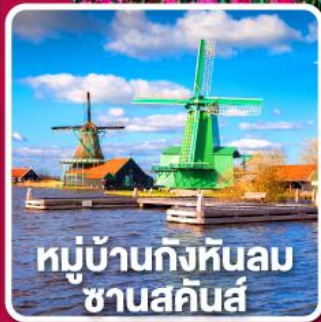
หมู่บ้านกังหันลม ซานสคินส์

เข้าชมเทศกาล สวนดอกไม้เคอเคนฮอฟ 1 ปีมีครั้งเดียว