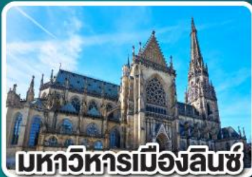
มหาวิหารเมืองลินซ์