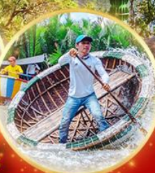
สุดพิเศษชมโชว์ Charming Show แสง สี เสียง สุดอลังการ