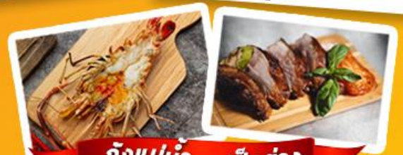
กึ่งแม่น้ำ + เบ็ดย่าง