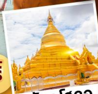
วัดกุโสดอ