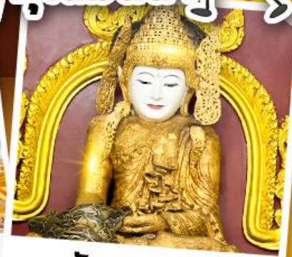
วัดมยุพะยา