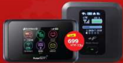
POCKET WIFI สำหรับนำไปใช้กับระบบนำเที่ยว เช่น 50 มิถุนายน