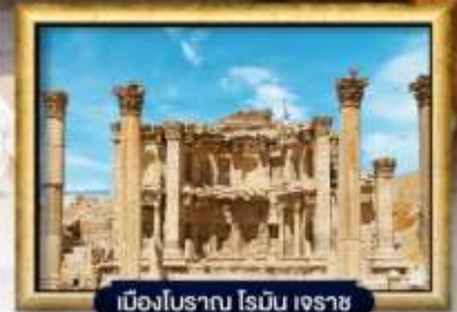
เมืองโบราณ ไรบิม เจราช