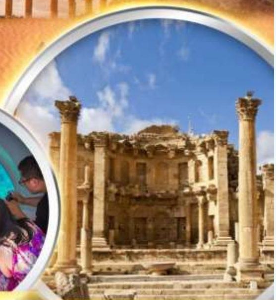
เมืองโบราณ โรมัน เจราช

ตามรอย 1 ใน 7 สิ่งมหัศจรรย์ของโลก มหานครเฟตรา พิเศษ!! ล่องเรือท่องทะเล ชมปะการังที่เมืองอคาบา สัมผัสบรรยากาศแห่งทะเลทรายวาดีรัม