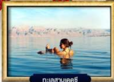
ทะเลสาบเดดซี