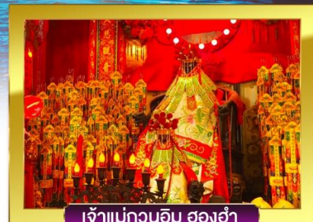
เจ้าแม่กวนอิม ฮองอ่า