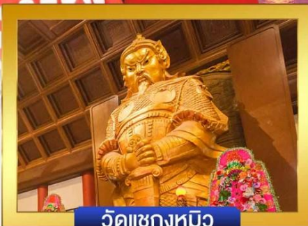
วัดแซงทมิว