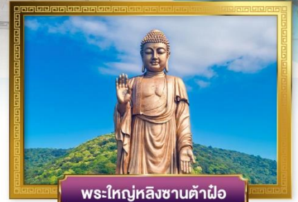
พระใหญ่หลิงซานต้าผิว

พิเศษ!! เสี่ยวหลงเปา, ซิโครงหมูอู่ซี, ไก่จอกานและหมูพันปี