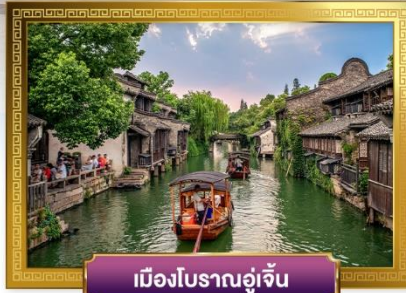
เมืองโบราณอู่เจิน