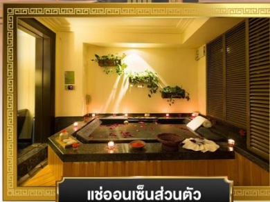
แช่ออนเซ็นส่วนตัว

• พระราชวังฤดูร้อน และจักรัสนเทียนอันเหมิน