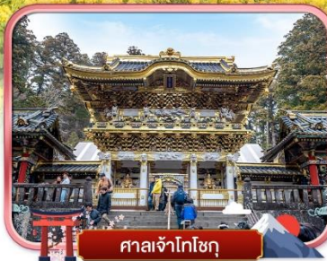
ศาลเจ้าโทโชกุ