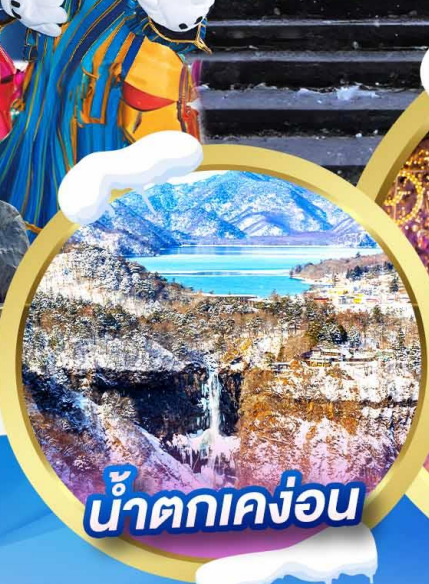
น้ำตกเคง่อน