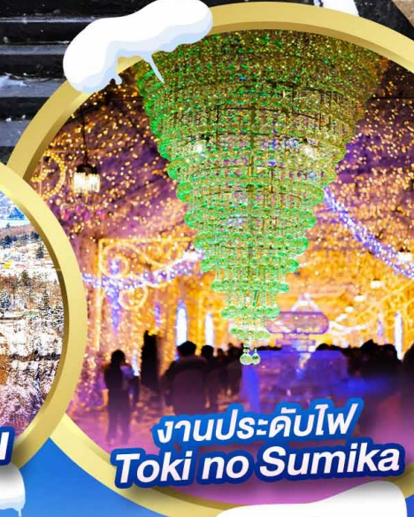
งานประดับไฟ Toki no Sumika