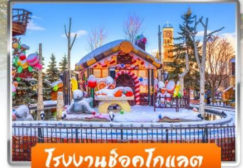
โรงงานช็อกโกแลต