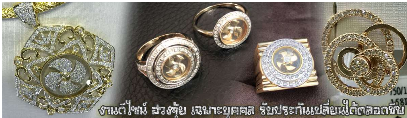
งานดีไม่แพ้ สวยจุกุ้ย เจมาอะบุศคคส รับประกันเปลี่ยนไม่ตัดลดซ้ำ

นำท่านเยี่ยมชม โรงงานจิวเวลรี่ ที่ขึ้นชื่อของฮ่องกงพบกับงานดีไซน์ที่ได้รับรางวัลอันดับยอดเยี่ยม และใช้ในการเสริมดวงเรื่อง ฮวงจุ้ยนำความโชคดี มั่งมั่งแก่ผู้สวมใส่ ซึ่งในเมืองไทยก็ได้นิยมแพร่หลายออกไป ไม่กว่าจะเป็นกลุ่ม ดารา นักการเมือง พ่อค้าแม่ขายที่ประกอบธุรกิจ เจ้าของกิจการห้างร้านต่าง ๆ ซึ่งเชื่อกันว่าจะนำสิ่งดี ๆ ปิดเป่าสิ่งชั่วร้ายให้กับบุคคลที่สวมใส่ ซึ่งจะมีมากมายหลายชนิด เช่น จี้กั๊กหัน แหวนรุ่งต่าง ๆ นาฬิกาข้อมือ (ซึ่งผู้สวมใส่จะได้รับการดูอายุมือจากซินเซประจำร้าน เพื่อแนะนำวิธีการเสริมดวงในการสวมใส่โดยไม่ได้คิดค่าบริการ)