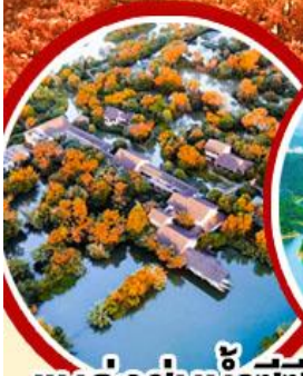
แหล่งช้อปปิ้งน้ำซีซี