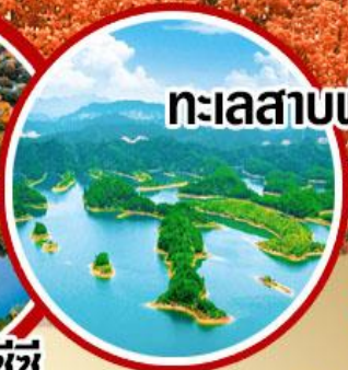
ทะเลสาบพินเกาะ