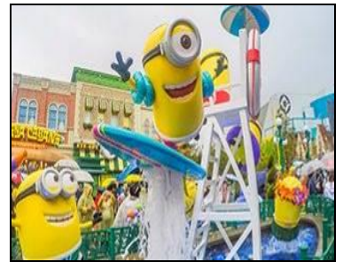
อิสระอาหารกลางวันตามอัธยาศัย (ไม่รวมในรายการ)