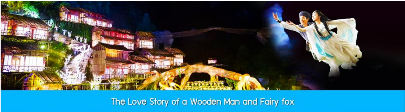
The Love Story of a Wooden Man and Fairy fox

นำท่านขึ้น พิชิตยอดเขาเทียนเหมินซาน 天门山 โดยสารกระเช้าที่ยาวที่สุดในโลก (กระเช้ามีความยาวถึง 7.5 กิโลเมตร) อยู่สูงเหนือระดับน้ำทะเล 1,518 เมตร ขณะที่นั่งกระเช้าขึ้นเขาสามารถชื่นชมทัศนียภาพที่สวยงามของภูเขาที่มีความอลังการแห่งนี้ สามารถมองเห็นประตูสวรรค์ซึ่งเป็นโพรงหินขนาดใหญ่บนยอดเขา มองเห็นความคดเคี้ยวของ เส้นทาง 99 โค้ง และภูเขาสูงใหญ่มากมายที่ตั้งตระหง่านเสียดฟ้า เมื่อถึงยอดเขาเทียนเหมินซาน นำคณะเดินตามเส้นทางชมวิวเลียบบนภูเขาและหน้าผา ชมทัศนียภาพจากมุมสูงบนยอดเขา อีกทั้งได้สัมผัสการเดินทางบนพื้นกระจกใสของ ระเบียงกระจกใสเลียบบนหน้าผา เพื่อวัดความขี้ลาดของท่าน สำหรับนักท่องเที่ยวใจเสาะที่ไม่ต้องการเผชิญกับความหวาดเสียว สามารถนั่งรถบริเวณทางออกอีกด้านของ ระเบียงกระจกใสเลียบบนหน้าผา 玻璃栈道 ... จากนั้นนำท่านสู่ โพรงประตูสวรรค์ 天门洞 โดย บันไดเลื่อนที่สร้างขึ้นโดยการเจาะทะลุภูเขา 穿山手扶梯 มีความสูงถึง 7 ชั้น เป็นสิ่งอำนวยความสะดวกใหม่ล่าสุดของเขเทียนเหมินซาน ซึ่งหาดูได้ยากตามแหล่งท่องเที่ยวต่างๆ ทั่วโลก บริเวณนี้ ท่านจะได้ถ่ายภาพ ประตูสวรรค์ อย่างใกล้ชิด จากนั้นท่านสามารถทดสอบกำลังขาของท่าน โดยการเดินลงบันได 999 ชั้น เพื่อลงมายังลานจอดรถและที่อยู่ด้านล่างของประตูสวรรค์ ในปี 1990 มีนักบินชาวรัสเซียขับเครื่องบิน 3 ลำบินลอดผ่านช่องโพรงหินประตูสวรรค์แห่งนี้พร้อมกัน ภาพประวัติศาสตร์นี้ถูกบันทึกและเผยแพร่ไปทั่วโลก ภูเขาเทียนเหมินซานจึงเป็นที่รู้จักของนักผจญภัยทั่วโลกที่อยากเดินทางมาสัมผัสด้วยตัวเอง.....จากนั้นนำท่านนั่งกระเช้าลงจากเขาเทียนเหมินซาน .....หลังจากเขาเทียนเหมินซาน นำท่านสู่ภัตตาคาร