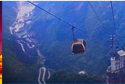
กระเช้าขึ้นเทียนเหมินซาน