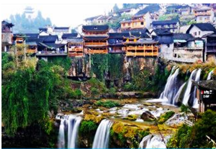
เมืองโบราณฝูหรงเจิ้น

พักที่ FURONGZHEN CHAXITAI HOTEL โรงแรมระดับ 4 ดาวหรือเทียบเท่าในเมืองโบราณฝูหรงเจิ้น