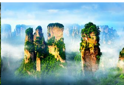
ภูเขาอวตาร