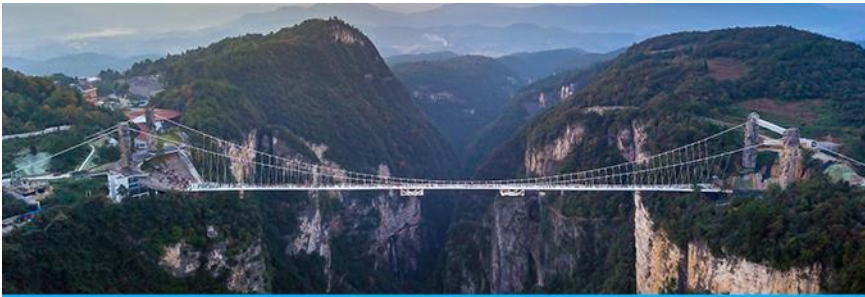
สะพานกระจกจางเจียเจี๋ย