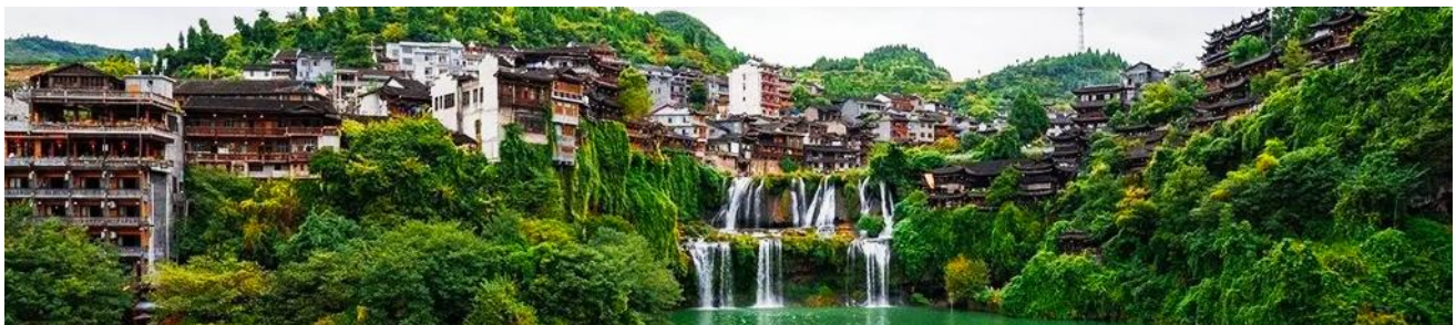
เมืองโบราณฝูหรงเจิ้น