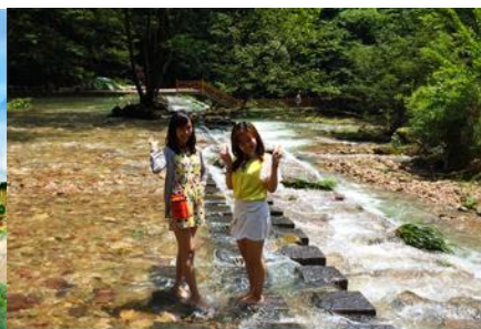
ลำธารจินเปียนซี

วันที่สี่ เมืองจางเจี๋ยเจี๋ย-ลิฟท์แก้วขึ้นเขาเทียนจื่อซาน -ภูเขาฮาเลลูย่า- สะพานหนึ่งในได้หล่า –ลำธารจินเปียนซี (นอนอุทยานหวู่หลิงหยวน)