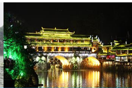
เมืองโบราณฝ่งหวง

วันที่สอง เที่ยวชมเมืองโบราณฝูหรงเจิ้น- เมืองโบราณฝ่งหวง - ล่องเรือแม่น้ำถั่วเจียง - เที่ยวชมเมือง โบราณฝ่งหวง นอนฝ่งหวง