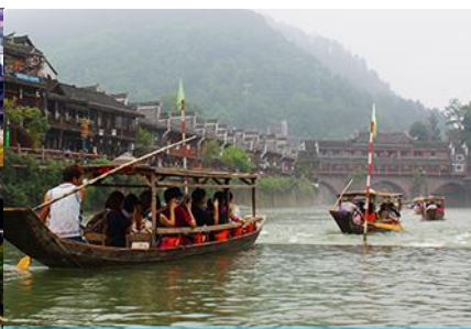
ล่องเรือแม่น้ำถั่วเจียง