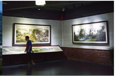
พิพิธภัณฑ์ภาพหินทราย

วันที่ห้า อุทยานหวู่หลิงหยวน - เลือกซื้อโปรแกรมทัวร์เสริม(สะพานกระจกข้ามหุบเขาแกรนด์แคนยอน) – พิพิธภัณฑ์ภาพหินทราย - เดินทางกลับกรุงเทพฯ