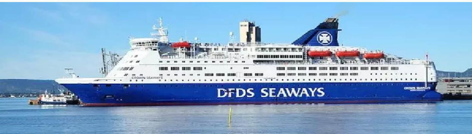
นำคณะพักบน เรือสำราญ SCANDINAVIAN SEAWAYS (Overnight Cruise) ห้องพักรูแบบมีหน้าต่าง (คืนที่ 7)