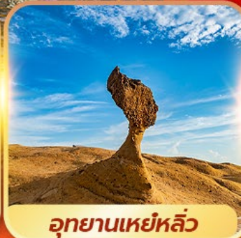
อุทยานเหยหลิว