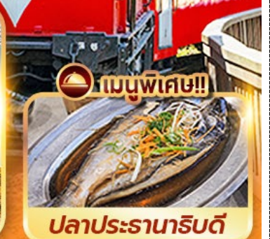
เมนูพิเศษ!! ปลาประรานาธิบดี