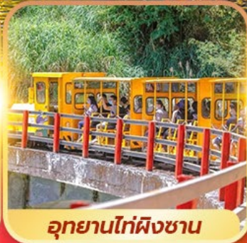
อุทยานไถ่ฝิงซาน