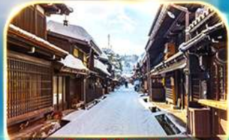
เมืองเก่าชินมาชิซูจิ