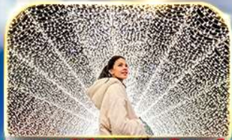
ชมงานประดับไฟนาบานา โมะ ซาโตะ