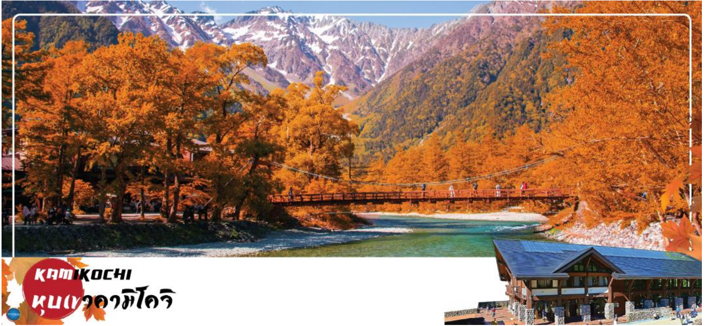
KAMIKOCHI หุบเขาคามาจิ

จากนั้นนำท่านเดินทางสู่ คามิโคจิ (Kamikochi) (ใช้เวลาเดินทางประมาณ 50 นาที) แหล่งท่องเที่ยวทางธรรมชาติที่มีทิวทัศน์ภูเขาที่สวยงามที่สุดแห่งหนึ่งของประเทศญี่ปุ่น ดินแดนแห่งธรรมชาติท่ามกลางหุบเขาแสนสวยของเทือกเขา "เจแปน แอลป์" (Japan Alps) เป็นหุบเขาในพื้นที่อยู่สูงขึ้นไปทางเหนือของเทือกเขาแอลป์ญี่ปุ่น ภาพสายน้ำของแม่น้ำอะซุสะ ที่ใสสะอาดไหลผ่านสะพานคัปปะ ล้อมรอบด้วยต้นป่าเขียวขจี และฉากหลังของยอดเขาสูงตระหง่านระดับ 3,000 เมตรให้ท่านได้เพลิดเพลินกับการเดินเล่นสบายๆ ไปกับธรรมชาติที่สวยงาม อิสระให้ท่านได้เก็บภาพความประทับใจตามอัธยาศัย สะพานคัปปะ-บะชิ เป็นจุดที่มีคนเยอะที่สุดในคามิโคจิ และในบางครั้งก็ให้ความรู้สึกเหมือนทางแยกที่มีชื่อเสียงของชินญะ มีผู้คนมากมายเดินข้ามไปข้ามมาอยู่ไม่หยุดหย่อน มาถ่ายรูปใกล้กับสะพานหรือบนสะพาน นำท่านเดินทางสู่ เมืองมัตสึโมโตะ (Matsumoto) เป็นเมืองที่ใหญ่เป็นอันดับสองของจังหวัดนากาโนะ (ใช้เวลาเดินทางประมาณ 1 ชั่วโมง)