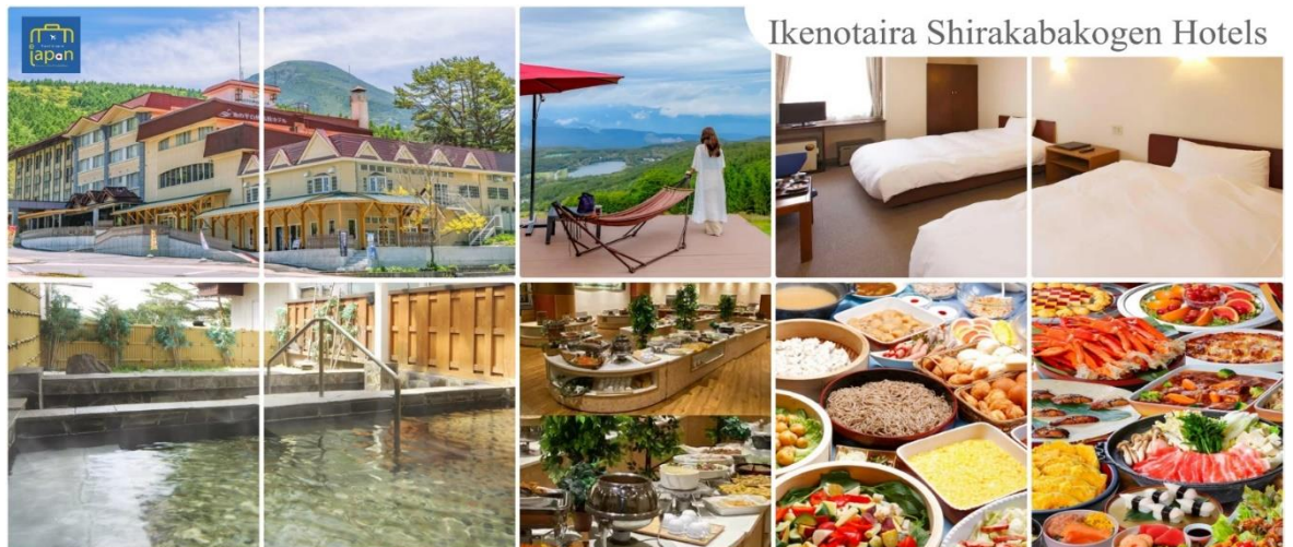
Ikenotaira Shirakabakogen Hotels

IKENOTAIRA SHIRAKABAKOGEN HOTELS, NAGANO หรือระดับเดียวกัน รับประทานอาหารค่ำ ณ ภัตตาคาร ของโรงแรม (5) --- บุฟเฟ่ต์นานาชาติ หลังอาหารให้ท่านได้ผ่อนคลายกับการแช่น้ำแร่ธรรมชาติ เชื่อว่าถ้าได้แช่น้ำแร่แล้ว จะทำให้ผิวพรรณสวยงามและช่วยให้ระบบหมุนเวียนโลหิตดีขึ้น